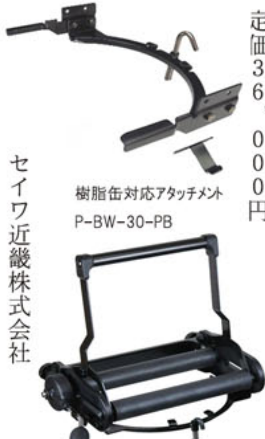
樹脂缶対応アタッチメント P-BW-30-PB

「樹脂缶対応アタッチメント P-BW-30-PB」 定価9,800円 「モップリンガー BW-30」 定価36,000円