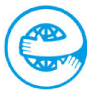
エコマーク認定商品 22129002