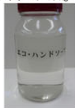
「再生油を使った」 エコ・ハンドソープ

本製品は、原料油脂中の50%にリサイクル食用油を使用することで、エコマーク認定を取得しております。スーパーマーケットや飲食店等から排出された食用油を原料として使用しているため、食用廃油の削減・パーム油の使用量削減に貢献します。