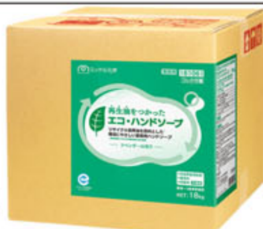
エコ・ハンドソープ 18 kg