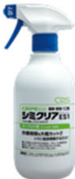
カーペキープ『シミクリアES1』 容量:450ml× 12本/ケース 定価:22,080円

いつもお世話になっております。シーバイエス㈱の皆元と申します。今回は新製品、過酸化水素をベースにしたカーペットのシミ取り時間を大幅にカットする『カーペキープ・シミクリアES1』をご紹介します。どうぞよろしくお願いいたします。