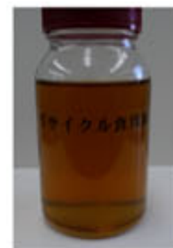
リサイクル食用油