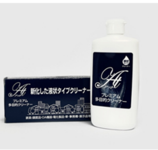
「アットプレミアム多目的クリーナー300mL」

これらの汚れのストレスをアットという間にキレイになっていく、「感動」を体験して頂きたく、アットプレミアム多目的クリーナーを、お役立て下さい！