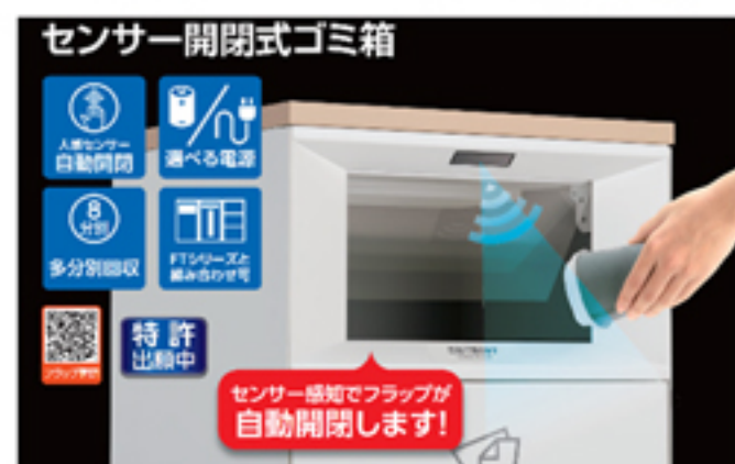
センサー開閉式ゴミ箱

触れずに捨てられて衛生的 どなたでも安心して使えます！ 人感センサー 自動開閉 選べる電源 多分割回収 1リレーと 集約のゴミ 特許 出願中 センサー感知でフラップが 自動開閉します！