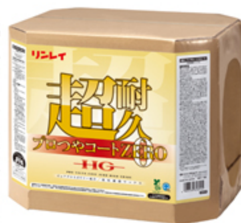
超耐久プロつやコート0 (ZERO)

また、低温時の作業性も良く、モップさばきも軽快に行えます。ご依頼頂ければサンブルもご準備させて頂きますので、お気軽にお声かけ下さい。よろしくお願いいたします。