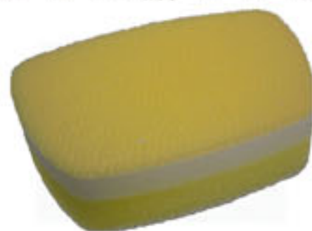
カキトリスポンジ

さて今回はもう一つ、弊社のオリジナル商品にあたる「カキトリスポンジ」についても説明をさせていただきます。カキトリスポンジの表面には細かくけば立つてブラシ状になっていて、そのブラシの先端が細かい凹凸や傷にも入り込み、大きな力を必要とせず汚れを効果的に除去できます。サイズも手のひらに収まりのいいサイズ感で、お風呂掃除に勧められたので家で試してみましたが、説明で聞いていた通り、ゴシゴシと擦らなくてもスッキリと汚れを落とすことが出来ました。またお風呂掃除だけではなく、しわの入ったビニールレザーや凹凸のある壁紙など、フラットではない面でも活躍できるスポンジだと再認識しました。価格もリーズナブルですので、皆様もぜひご使用してみてください。